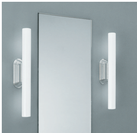
W-606, siehe Wandleuchte